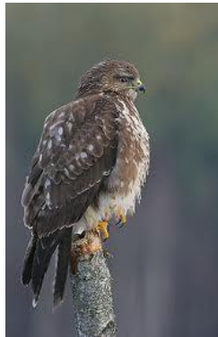
www.google.hu : Egerész-ölyv

Az egerészölyv hazánkban sík- és hegyvidéken egyaránt megtalálható ragadozó madár. Mint neve is árulkodik róla, előszeretettel vadászik egerekre és más rágcsálókra. Mivel táplálékforrása egész évben a rendelkezésére áll, hazánkban állandó madár, sőt állománya télen feldúsul a hozzánk északról érkező példányokkal. Az országos felmérések eredményei alapján az egerészölyv hazai állománya nem mutatott lényeges változást az elmúlt 10 évben. A korábbi, célzott táplálékvizsgálatok azt mutatják, hogy komoly gazdasági hasznot hajt, a rágcsálók fogyasztásával. Bővebben: http://www.foldegyesulet.hu/allatok/egereszolyv/egereszolyv.php