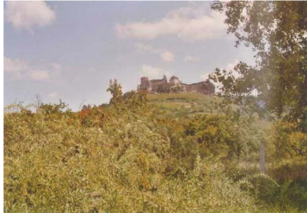
A Boldogkő Vára

A történet után a kis öreg néni könnyes szemmel még sokáig nézett maga elé. Aztán könnyét letörölve arra kért bennünket, hogy történetével aztán jól sáfarkodjunk