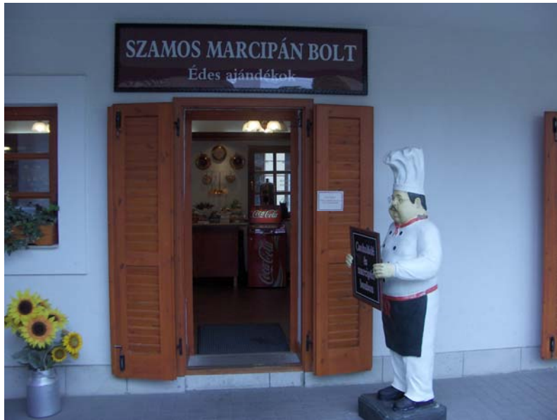
A Kopcsik Marcipánia