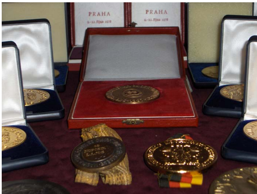
Kopcsik úr kitüntetései

1997-ben Karlsruhében négy aranyéremmel díjazták munkáimat. 1997-ben heves megye bemutatkozott Hollandiában és a rendezvény keretén belül szakmai kiállítást és bemutatót rendeztek munkáimból. 1997. augusztus 20.- án átvettem a Magyar Köztársasági Érdemrend Kiskeresztjét. Az 1997-ben kiadott Oscár-díjasok c. könyv társszerzője voltam.