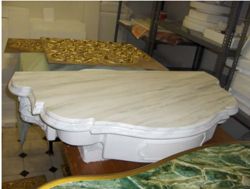
Itt készül a barokk asztalka