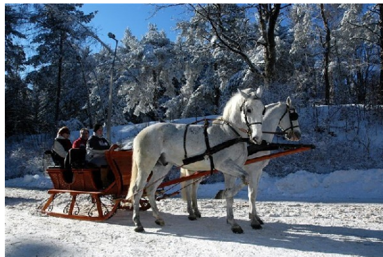
Küldő: Kisspál János-Mezőkövesd