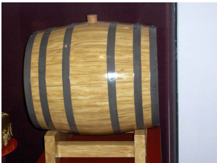
Az egri boroshordó

Vagy valójában imitációk az ólomüvegek, bár kerámiának, ötvösmunkának, olajfestménynek tűnő szépségek is, és a többi készítmény, amelyek itt sorakoznak. Óriási borospalack, levelezőlap, csodás köntösbe bújtatott jókora könyv, szinte megszólaló hanglemez és elegáns borítója, emlékeink hajdani gramafonja, mindenféle játék, cifra öltözék, bámulatos fegyver, és egyéb alakjában. “